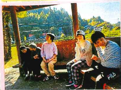
東陽町 石橋公園にて