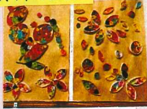
ペーパークッキング