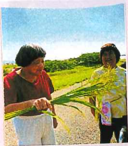
花の道ウォーキング