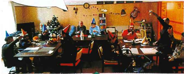
サマタさんからのプレゼント