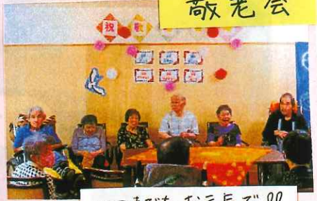
いつまでもお元気で!!