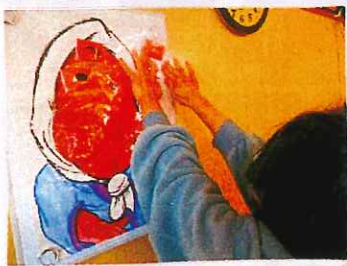
おみくじ 今年の運勢は?