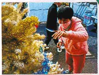
ツリーの飾りつけ