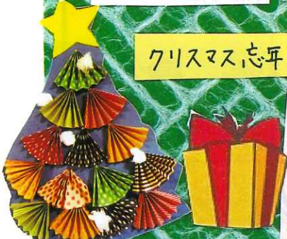
クリスマス忘年会