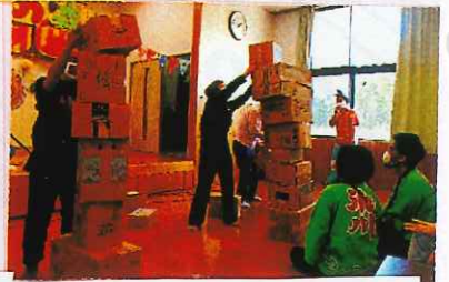
ユニット対抗「箱積みゲーム」