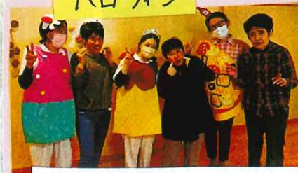
衣装した職員とホーズ