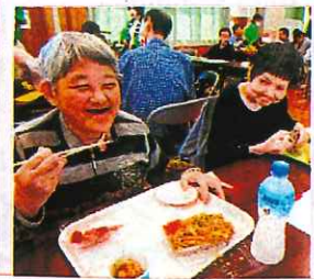
模擬店のおごちそう!