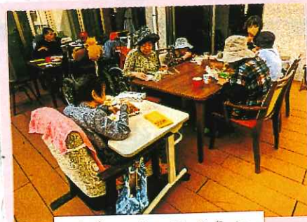
中庭に出てランチタイム