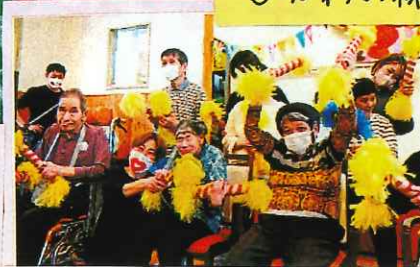
「マツケンサンバ」「ズンドコ節」 踊りの披露