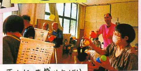
玉入れ 大盛り上がり